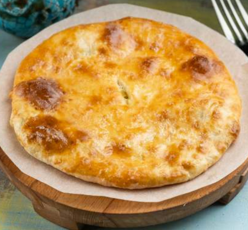
ХАЧАПУРИ с картофелем и сыром 150г | 230.-