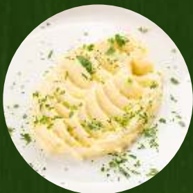
Воздушное картофельное пюре 150г | 150.-