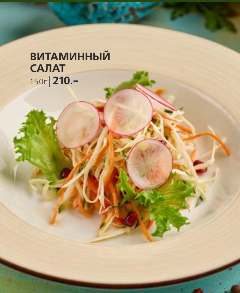
ВИТАМИННЫЙ САЛАТ 150г | 210.-