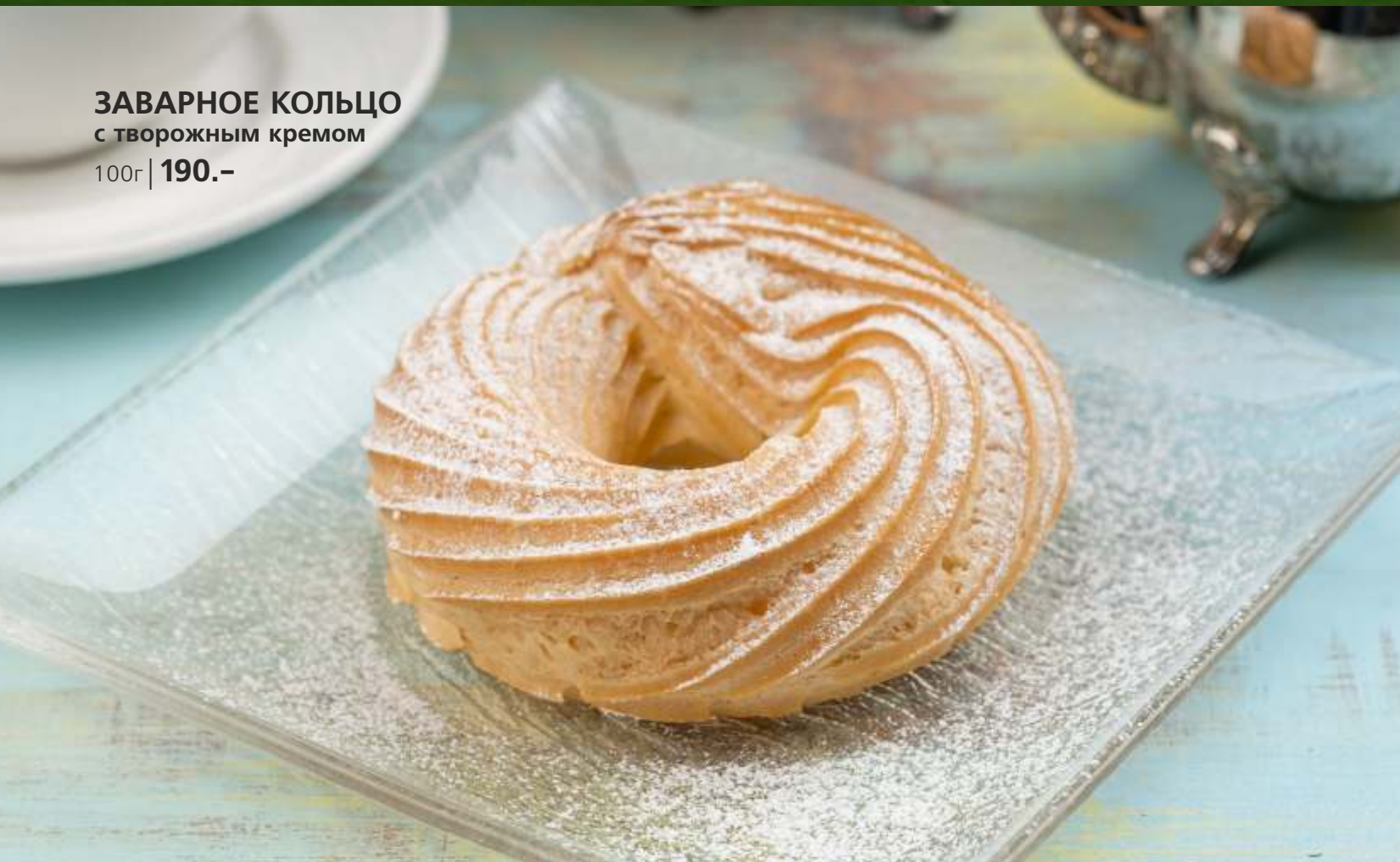
ЗАВАРНОЕ КОЛЬЦО с творожным кремом 100г | 190.-