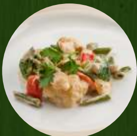
Овощи, томленые в сливках 130г | 160.-