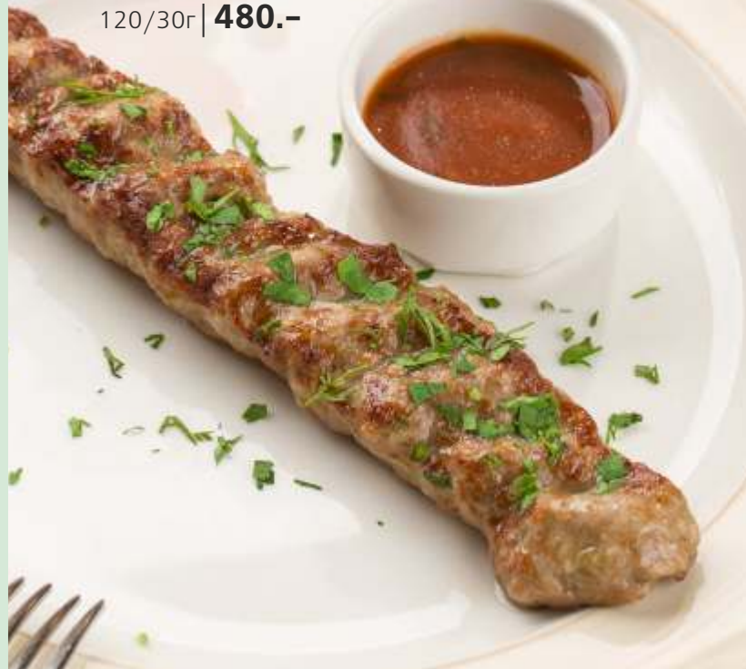
ЛЮЛЯ-КЕБАБ ИЗ БАРАНИНЫ с томатным соусом 120/30г | 480.-