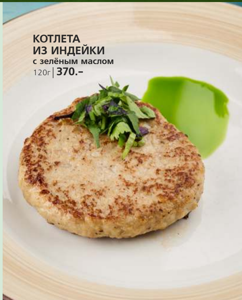
КОТЛЕТА ИЗ ИНДЕЙКИ с зелёным маслом 120г | 370.-