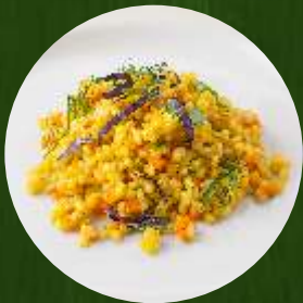
Каша перловая с овощами 150г | 110.-