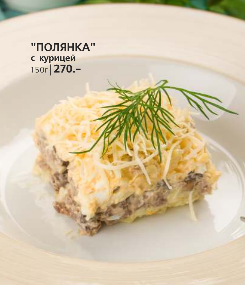
"ПОЛЯНКА" с курицей 150г | 270.-